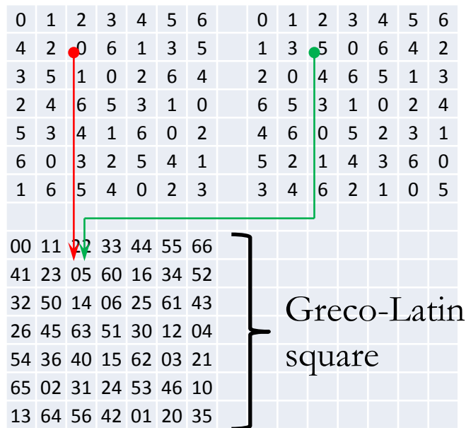
Fig. 2. Example of a pair of orthogonal Latin squares of rank 7, which are diagonal as well.